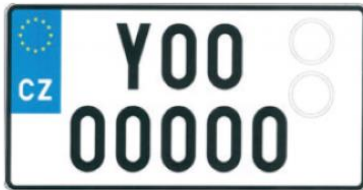
rozměr 320 x 160 mm