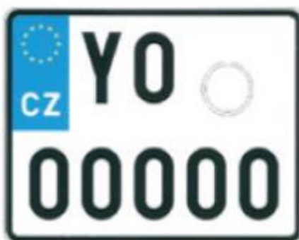
rozměr 200 x 160 mm